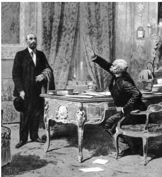
Georges Clemenceau reçoit Marcelin Albert, Une du "Petit Journal supplément illustré" du 7 Juillet 1907

Marcelin Albert proteste que son combat est uniquement celui de la viticulture, accessoirement les langues régionales. Complètement subjugué, il consent à retourner sa veste et à essayer de convaincre les maires de retirer leur démission. Les deux hommes se lèvent, Clemenceau remercie et recule d'un pas, matois. Il regarde Albert se tortiller, et s'efforce de ne pas rire. Il sait parfaitement que le paysan n'a pas un sou en poche, lui qui s'orientait encore vers la prison voici une heure. Matois, il lui propose un sauf-conduit qu'il lui signe aussitôt (Albert est théoriquement sous mandat d'amener et donc recherché par la Sureté), lui fourre un billet de 100 francs dans la main et lui propose de le faire raccompagner à la Gare de Lyon. Bredouillant des remerciements, Marcelin Albert accepte, en jurant ses grands dieux qu'il remboursera la somme dès que possible.